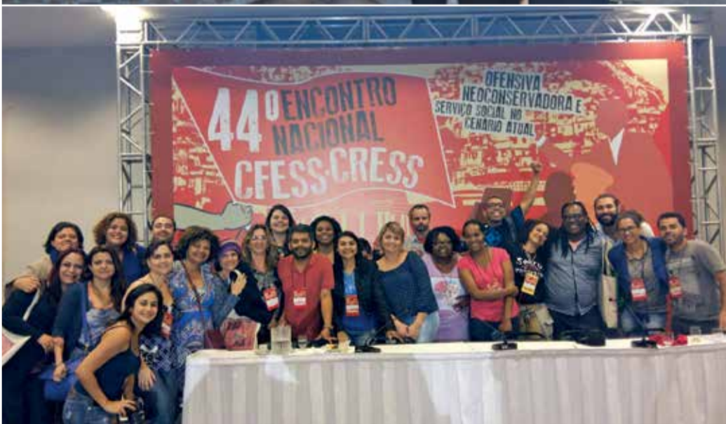
Imagens do Ato Público em Defesa dos Direitos das Crianças e Adolescentes, do Encontro Descentralizado da Região Sudeste e da delegação do CRESS-SP que participou do 44º Encontro Nacional CFESS-CRESS