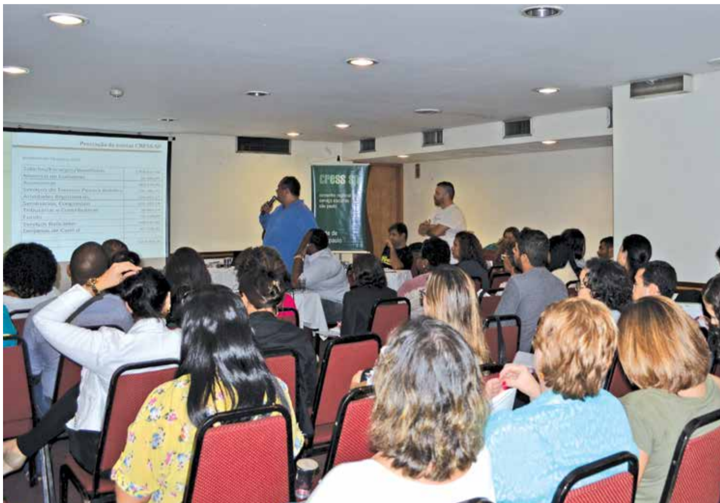
Deliberações da Assembleia Geral sobre a precarização do ensino foram enviadas por meio de moção disponível no site do Conselho

Também foi aprovada durante a Assembleia a moção de defesa dos direitos humanos da criança e do/a adolescente e contra a redução da maioria penal. A nota, também disponível no site do CRESS, repudia a atuação da Câmara dos Deputa-