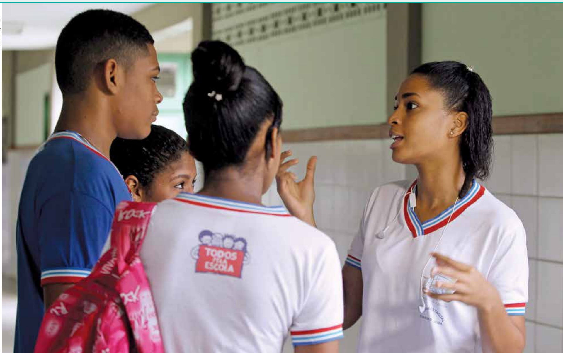
A evasão escolar é apenas uma das questões que evidenciam a crítica situação do ensino público no Brasil

à educação não é concretizado. Como o Serviço Social é uma profissão voltada à defesa dos direitos, vejo que existe uma relação e a evasão é uma frente de trabalho”, reflete.