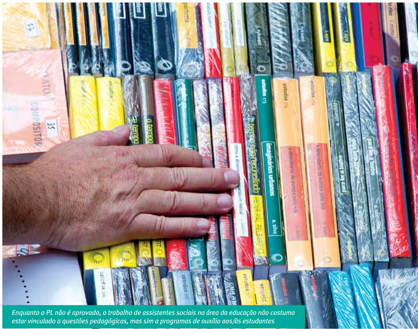
Enquanto o PL não é aprovado, o trabalho de assistentes sociais na área da educação não costuma estar vinculado a questões pedagógicas, mas sim a programas de auxílio aos/as estudantes