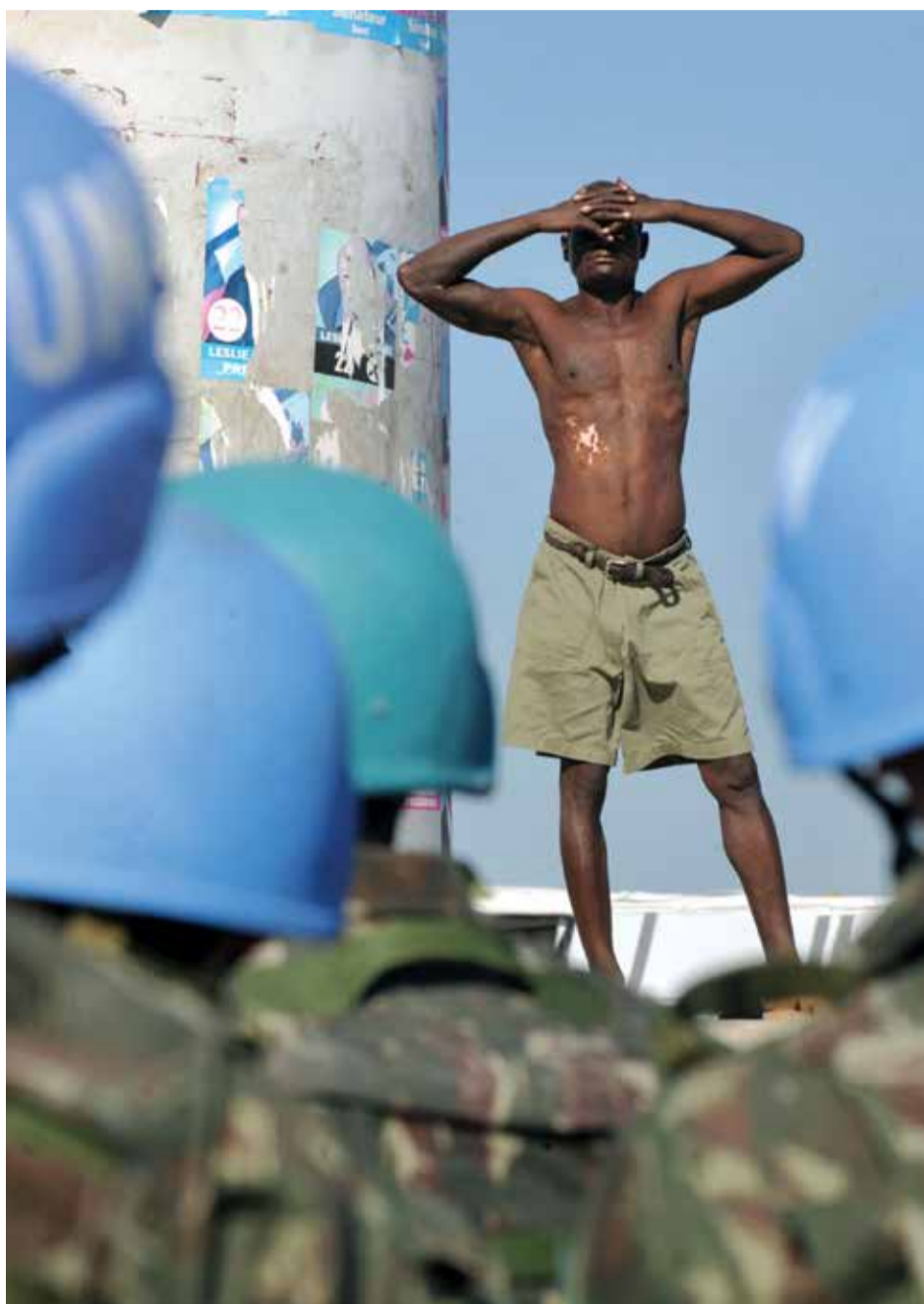
Gastos do Brasil com missão de paz no Haiti já passam de R$ 2 bilhões

Em nota publicada no site do CFESS, o Conselho chama a atenção para o papel que o Brasil desempenha de “dominância diante de países em condições econômicas mais debilitadas, tirando vantagens econômicas dessa relação e galgando posições políticas junto aos organismos multilaterais”. Para tentar conquistar uma cadeira no Conselho de Segurança da Organização das Nações Unidas (ONU), o Brasil enviou tropas ao Haiti e continua ocupando o país.