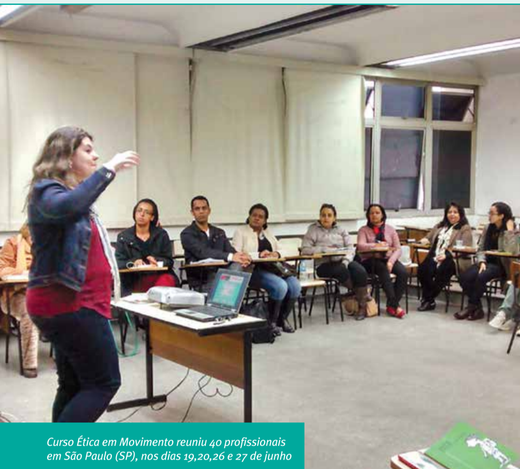
Curso Ética em Movimento reuniu 40 profissionais em São Paulo (SP), nos dias 19, 20, 26 e 27 de junho