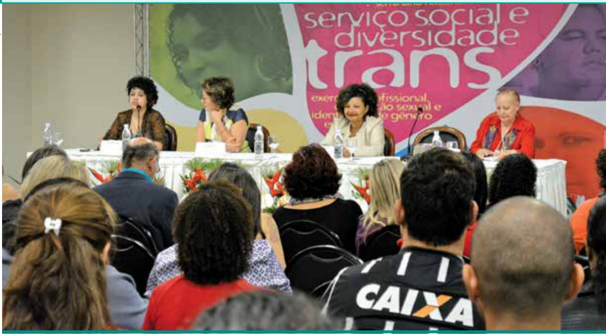
Seminário Nacional Serviço Social e Diversidade Trans, realizado em São Paulo (SP), em 11 e 12 de junho